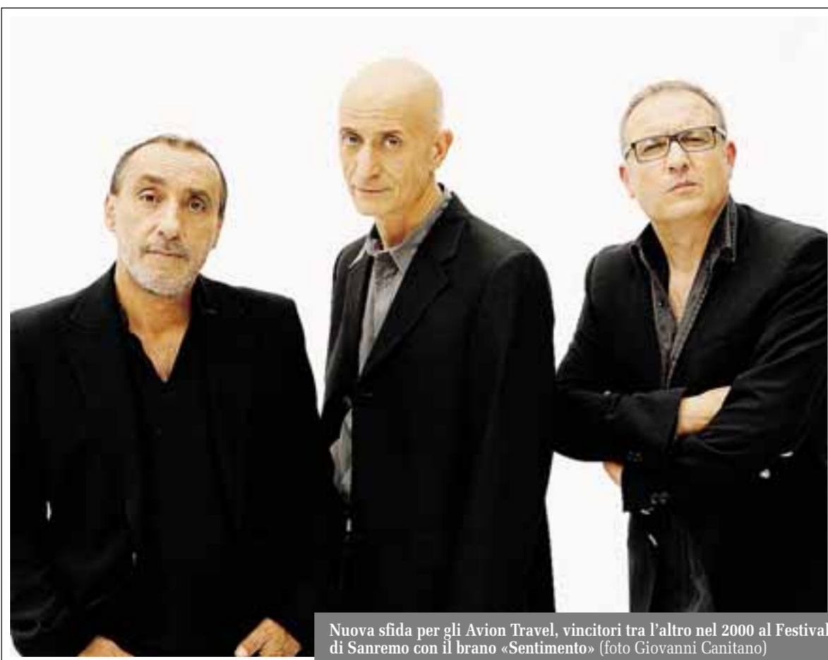
Nuova sfida per gli Avion Travel, vincitori tra l'altro nel 2000 al Festival di Sanremo con il brano «Sentimento»

Musicisti straordinari con tanto di voce teatrale, stavolta si sono messi alle spalle l'orchestra della Camerata Ducale di Vercelli diretta dal maestro Marcello Rota, dando incarico per gli arrangiamenti a Fabrizio Francia. Nel trentennale della morte hanno scelto la musica e le canzoni di colui che Fellini definiva l'amico magico, Nino Rota, uno dei compositori di musica da film (e non solo) più in vista del Novecento. Il disco - con l'aggiunta di un dvd live con sei pezzi - è bellissimo, raffinato ed umorale, perfettamente evocativo, proprio perché prova a distaccarsi dalle immagini di film come La dolce vita («Parlami di me»), Il padrino II-III («The Immigrant»), «Quello che non si dice», «Brucia la terra»), Amarcord («Lo struscio»), Le notti di Cabiria («Lla lì lli rà»), La strada («Gelsomina»), Boccaccio '70 . Da quest'ultimo si è scelta la goliardia di «Bevete più latte» invitando