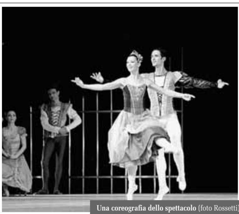
Una coreografia dello spettacolo

Il sipario si apre sulla festa per il compleanno del principe Sigfrido. Preziosi e ben curati i costumi così come l'allestimento, che ha il pregio di condurre subito il pubblico in un'atmosfera d'altri tempi. Per il principe è giunto il mo-