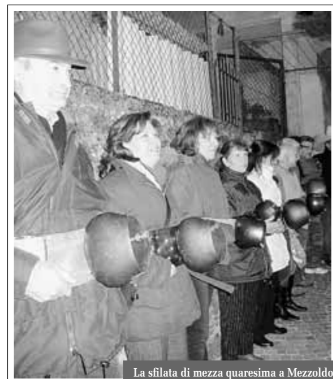
La sfilata di mezza quaresima a Mezzoldo